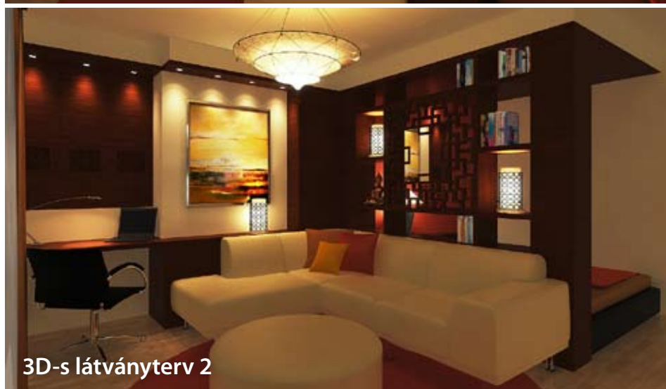
3D-s látványterv 2

Már csak a stílus lehet kérdéses. Hogy semmiképp se kelljen számúzni a meglévő szekrényeket, a szép kosarakat és dísz tárgyakat, lehetne akár kissé keleties is a hangulat, amolyan „zenes”. Persze épp csak annyira, hogy a polcelemekkel leválasztott hálósarok visszafogottsága valódi nyugalmat árasztson, a „nappali” pedig igazán kényelmes és bensőséges legyen, pihenéshez, vendégfogadáshoz egyaránt. A formabontó módon a térelválasztó elem mellé a közepébe illesztett tükör pontosan azt a teret hivatott optikailag „hozzácsalni”